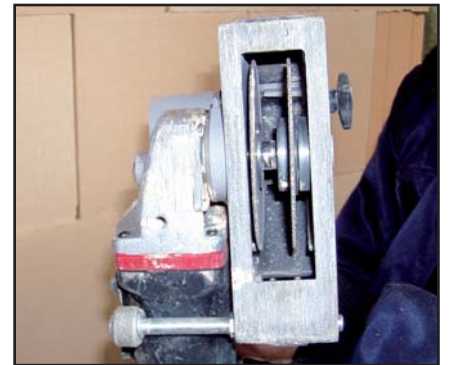
Spezial-Schlitzfräse mit 2 Diamant-Trennscheiben und verstellbarer Schnittbreite und -tiefe.