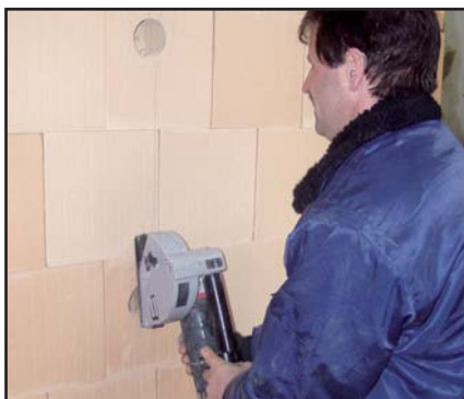
Schlitzten der Ziegel mit der Schlitzfräse.