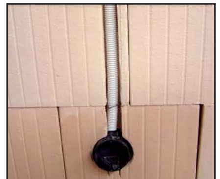
Einlegen der Elektroinstallation in die Schlitzte.