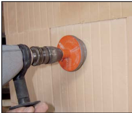
Elektrodose anzeichnen und mit handelsüblicher Bohrmaschine und Diamant-Trocken-Bohrkrone Kernbohrung vornehmen.

Weiterhin gilt: Möglichst großen Abstand von hochbelastetem Mauerwerk (z.B. unter Stürzen) einhalten, schlitzten schmaler Pfeiler vermeiden, horizontale Schlitzte in höchstens 40 cm Abstand über dem Fußboden oder unter der Decke.