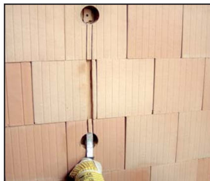
Vorgesägte Schlitzte mit Hammer und Meißel freischlagen.